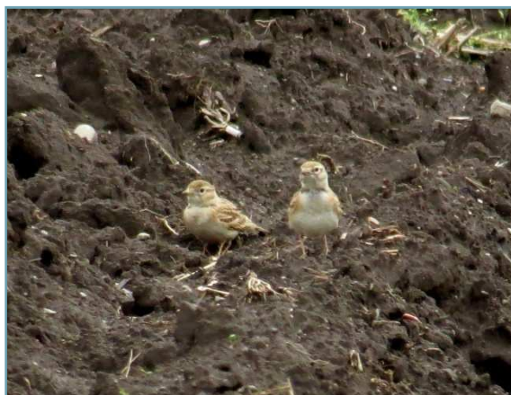
Calandrella – 2/05/2017 Brebbia

La precedente segnalazione è relativa al 1965