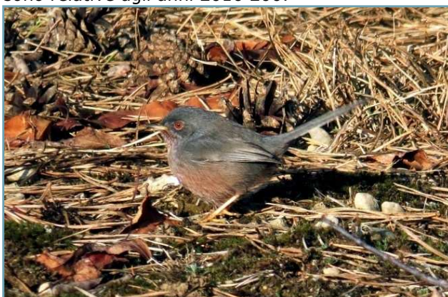
Magnanina comune – 21/01/2017 Lonate Pozzolo

Le precedenti segnalazioni sono relative agli anni 2016 2007