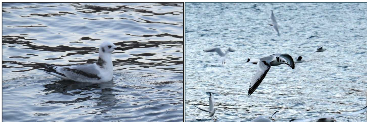
Gabbiano tridattilo – 9/12/2017 Lago Ceresio Gabbiano tridattilo – 9/12/2017 Lago Ceresio

Le precedenti segnalazioni sono relative agli anni: 2012 1998 1965 1947 1937 1926