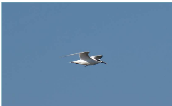
Beccapesci – 23/08/2017 Lago Maggiore

Le precedenti segnalazioni sono relative agli anni: 2015 2011 2005 2004