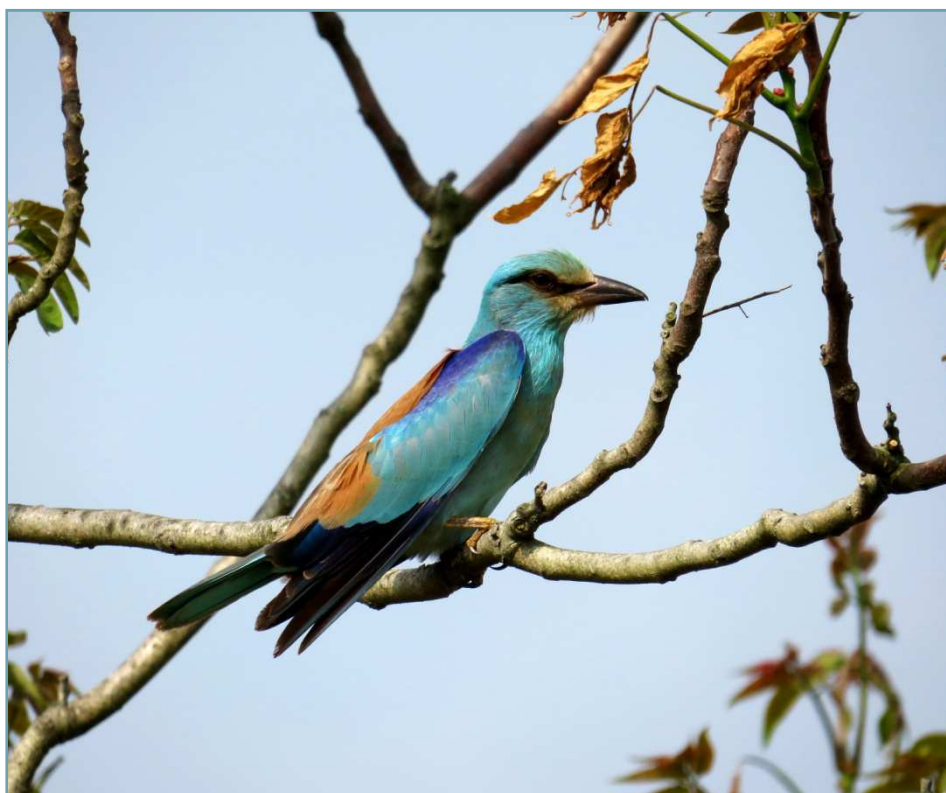
Ghiandaia marina - 19/05/2017 Lonate Pozzolo

Roberto Aletti Gruppo Insubrico di Ornitologia