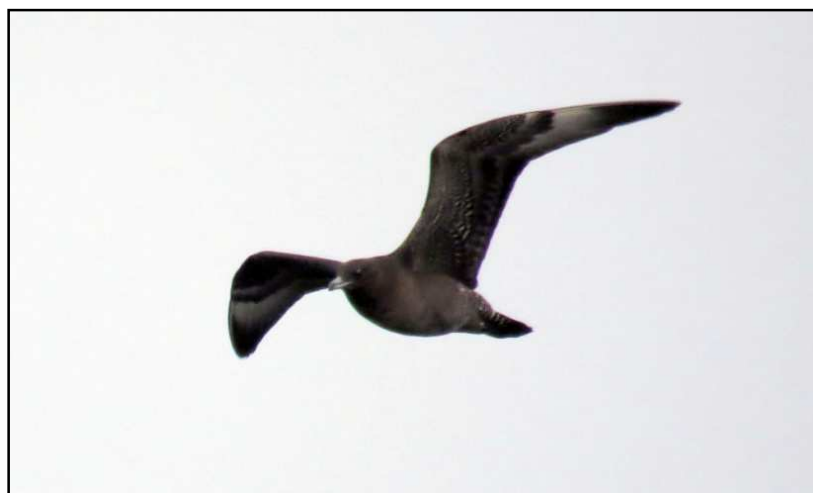
Stercorario mezzano – 8/12/2017 Lago Maggiore