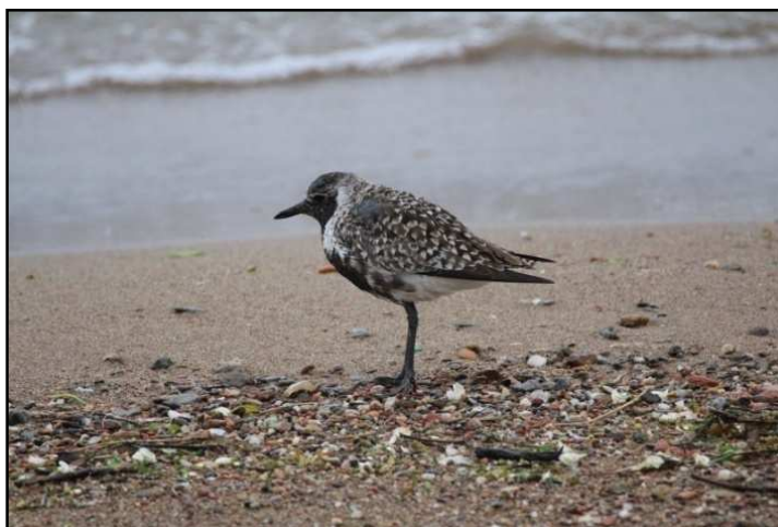
Pivieressa – 1/05/2017 Foce Tresa