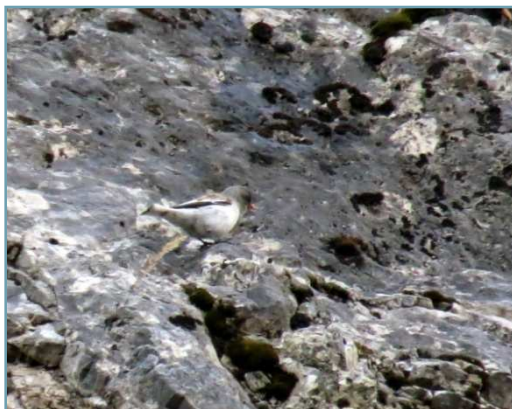
Fringuello alpino – 28/12/2017 Castelveccona

La precedente segnalazione è relativa all' anno 1963, altre non considerate perché non meglio documentate anni 1946 1945