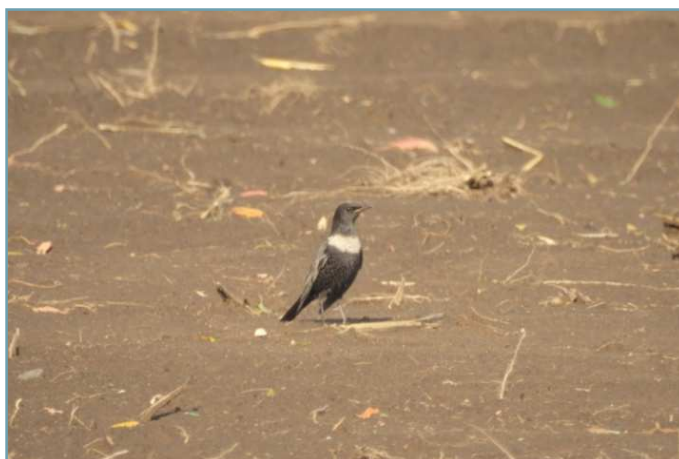
Merlo dal collare – 7/11/2017 Brebbia