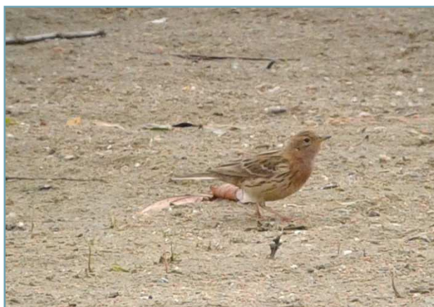
Pispola golarossa – 25/04/2017 Foce Tresa (foto Fabio Saporetti)