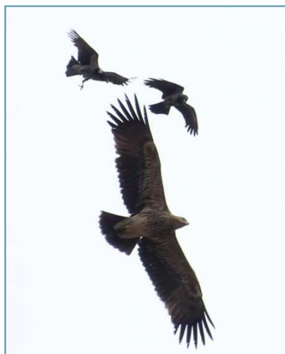
Aquila imperiale - 4/05/2017 Casorate Sempione