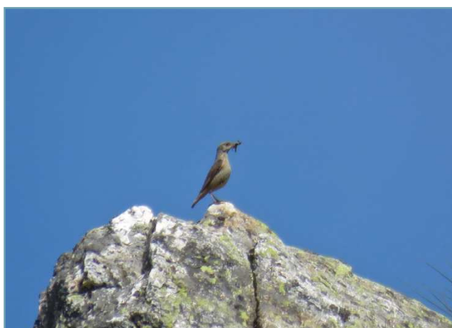
Codirossone – 22/07/2017 Alta Veddasca