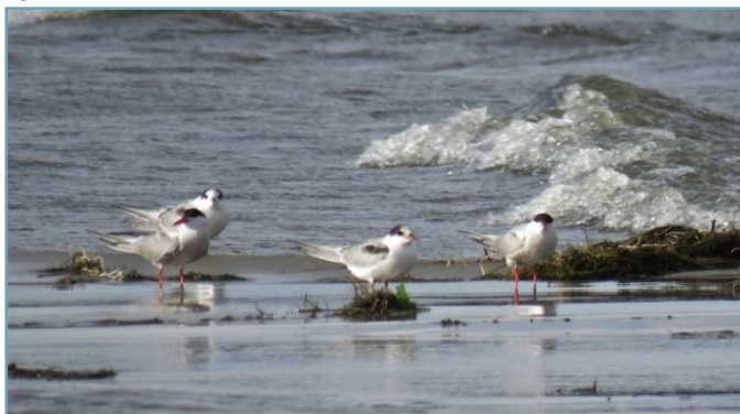
Sterna comune – 11/08/2017 Lago Maggiore