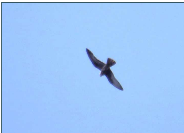
Falco della Regina – 17/08/2017 Monte Cuvignone