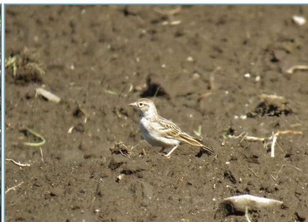
Calandrella – 2/05/2017 Brebbia