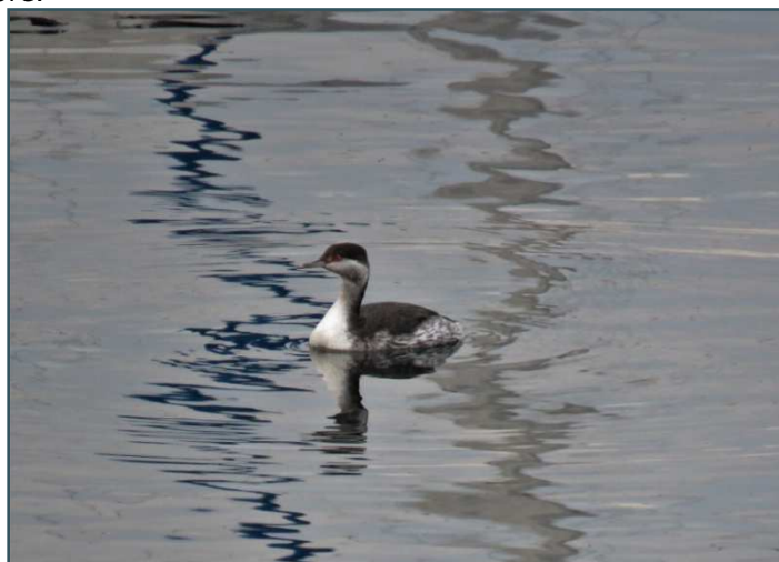
Svasso cornuto - 19/12/2017 Lago Maggiore