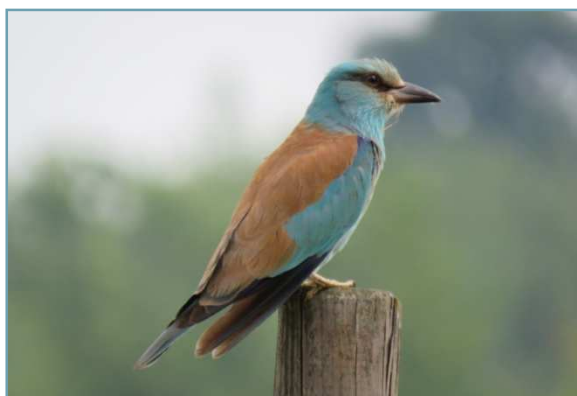
Ghiandaia marina – 19/05/2017 Lonate Pozzolo